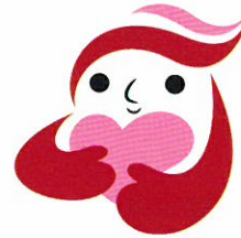
犯罪被害者等支援 シンボルマーク 「ギュっとちゃん」

【JR嵯峨野線】「丹波口」駅 徒歩4分 【阪急京都線】「大宮」駅 徒歩7分 【京福電鉄嵐山本線】「四條大宮」駅 徒歩7分